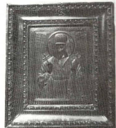
Preziosa icona russa di Noradino Olivier.

In occasione delle festività natalizie, giunga a voi, Capi Gruppo, il mio grazie per la collaborazione preziosa che date alla Sezione, per l'entusiasmo che conservate per la nostra «specialità» e per la nostra Associazione, per le iniziative che con i vostri soci avete messo in cantiere o condotto in porto, per l'impegno per cercare di mantenere il numero dei soci e possibilmente aumentarlo e anche per la forza di volontà che avete dimostrato per superare avversità e in-