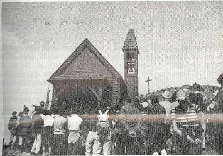
La chiesetta del Col di Lana

E lassù, sul «Monte di fuoco», tutto ci riporta ai tempi dei nostri padri. Nella dura salita ci sembra che la terra arida odori ancora di sangue di decine di migliaia di nostri soldati e di quelli avversari. Le nostre stille di sudore che scendono dalla fronte bagnano quella terra rossiccia, nella quale settan-