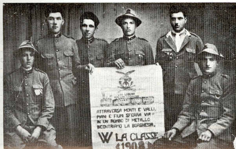
Congedanti di 50 anni fa...